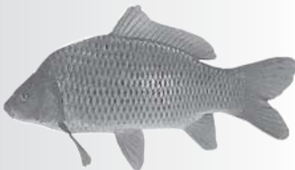
De Gouden Karper

Herberg De Gouden Karper, één van de oudste horecabedrijven van Noord-Nederland, ademt nog steeds de sfeer van weleer. U kunt smakelijk en gevarieerd eten in ons eetcafé