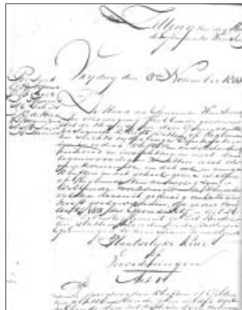
Begin van de gemeentelijke keur op de kluften, vastgesteld in de raadsvergadering van vrijdag 8 november 1833. (Archieven Gemeente Winsum, Archief Gemeentebestuur, inv. nr. 2, Registers van Notulen van vergaderingen van de gemeenteraad. Foto J. Tersteeg).