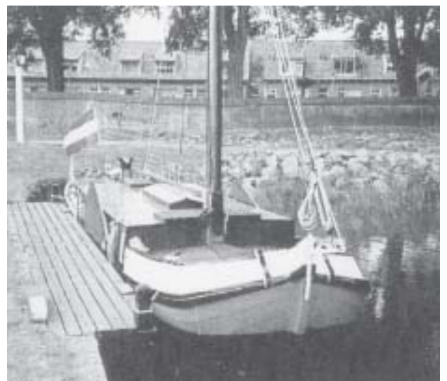
Het potschip 'Twee Gebroeders', gebouwd in 1894 te Sneek, in het Zuiderzeemuseum te Enkhuizen.