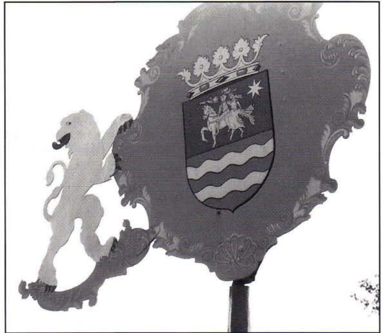
Windvaan Schaphalsterzijl met wapen voormalig waterschap Hunsingo.

De oude sluisen van Schaphalsterzijl, nabij het Reitdiep, staan de laatste tijd volop in de belangstelling. Het ligt in de bedoeling daar een gemaal met schutsluis te stichten om de gevolgen van de bodemdaling door aardgaswinning op te vangen.