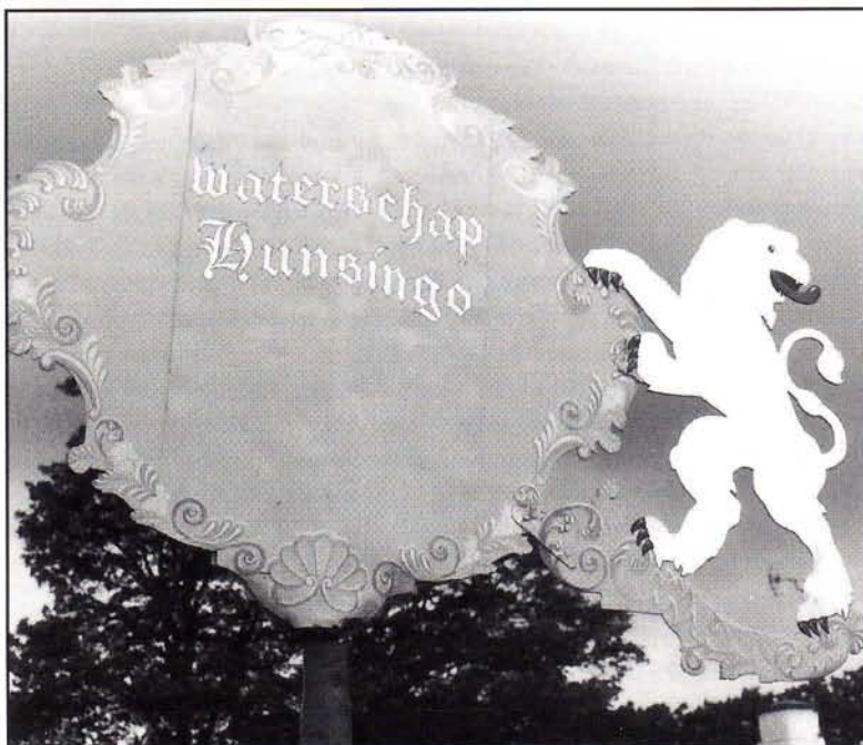
Achterkant windvaan Schaphalsterzijl.