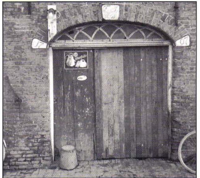
Achterdeur met gevelstenen van de boerderij Dorrevenne.