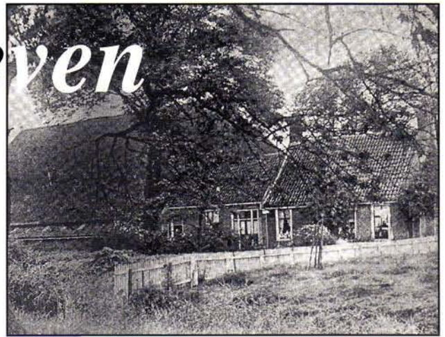
De boerderij Dorrevenne in 1962.